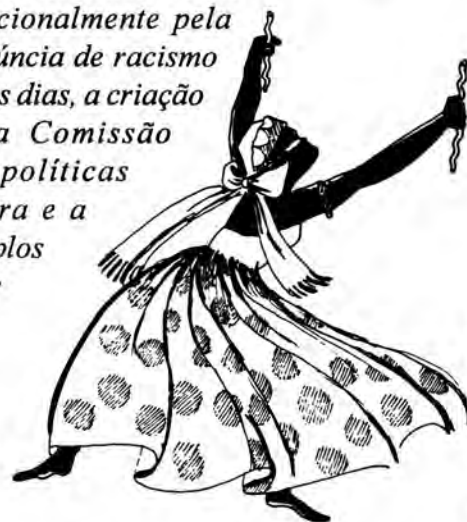
especial fempress 1995

A mulher negra caminha junto nessas conquistas. É para as Benés e Xicas da Silva que a senadora prevê um 1997 promissor. Um momento em que os negros e as negras querem a sua preservação cultural. E a senadora vai mais longe: "se poder é bom negro quer poder". (Pág. 6)