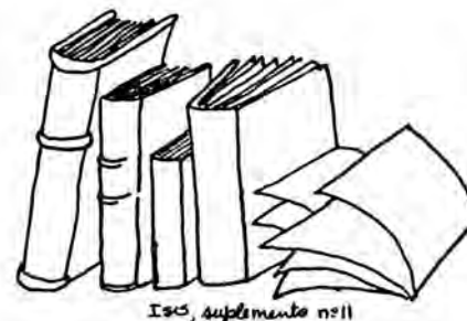
Isos, suplemento nº11

A faixa entre os 24 e os 30 anos de idade corresponde exatamente ao período em que as mulheres assumem responsabilidades familiares,