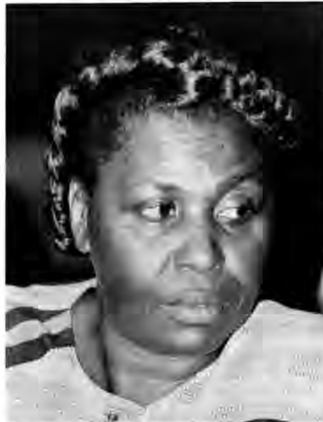
Senadora Benedita da Silva (PT-RJ)

A senadora Benedita da Silva (PT-RJ), a “Bené”, sabe o que é ser atrevida. Da favela ao poder. A trajetória foi difícil. Mas nunca abandonou a luta. Como ela mesmo afirma, a “mulher negra é atrevida. É bunduda e atrevida. É empinada prá frente e prá trás. São mulheres que estão numa luta constante. A luta para elas não pára nunca”. A senadora reconhece que hoje no Brasil os negros e negras estão participando de um novo contexto: a vinda do reverendo negro norte americano Jesse Jackson, conhecido internacionalmente pela defesa dos direitos humanos, a