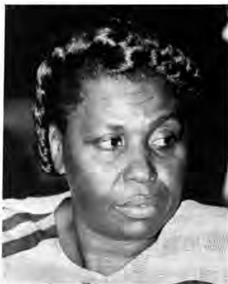
Senadora Benedita da Silva (PT-RJ)

A senadora Benedita da Silva (PT-RJ), a "Bené", sabe o que é ser atrevida. Da favela ao poder. A trajetória foi difícil. Mas nunca abandonou a luta. Como ela mesmo afirma, a "mulher negra é atrevida. É bunduda e atrevida. É empinada prá frente e prá trás. São mulheres que estão numa luta constante. A luta para elas não pára nunca". A senadora reconhece que hoje no Brasil os negros e negras estão participando de um novo contexto: a vinda do reverendo negro norte americano Jesse Jackson, conhecido internacionalmente pela defesa dos direitos humanos, a denúncia de racismo estampada nos jornais quase todos os dias, a criação pelo Governo Federal de uma Comissão Interministerial para analisar políticas públicas para a comunidade negra e a eleição de prefeitas negras são exemplos de que o negro intensifica o seu lugar na sociedade brasileira que sempre escamoteou o racismo.