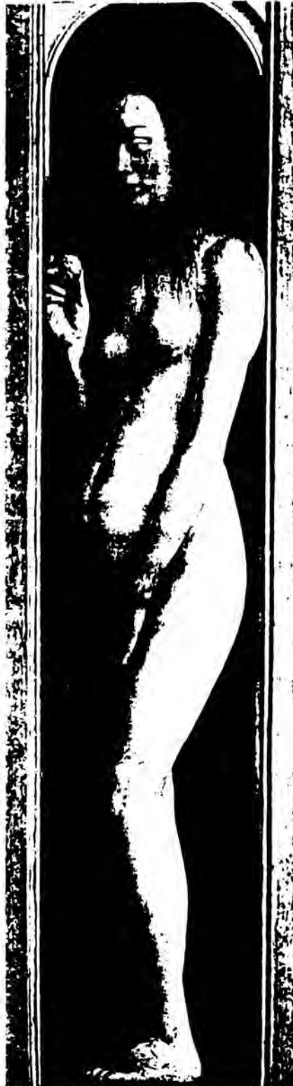
mujer fempress especial

É preciso que seja respeitada a liberdade de culto e confissão religiosa e a de expressar a visão de