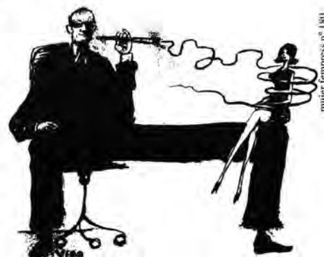
mulher impressa n° 180

Garante ainda a aquele(a) que registrar queixa de assédio sexual a estabilidade provisória no emprego pelo período de um ano, a contar da data da formalização da denúncia. Esta estabilidade também pode ser convertida em indenização, paga em dobro, correspondente ao período