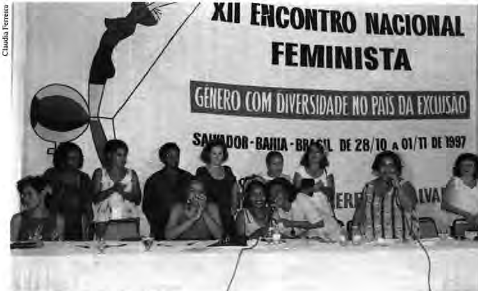
Encontro Feminista realizado em Salvador.

No dia 28 de outubro, foi aberto, em Salvador, Bahia, o XII Encontro Nacional Feminista, sob o título Gênero com diversidade no país da exclusão . A garra e a determinação da Comissão Organizadora garantiram a realização do Encontro aguardado há seis anos. Mais de 700 mulheres de todo o país tiveram a oportunidade de participar de cerca de 70 atividades, entre mesas redondas, oficinas, mostras de vídeo, exposições fotográficas e atividades culturais realizadas durante os 5 dias, no Hotel da Bahia.