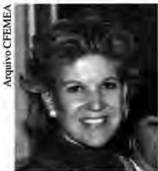
Deputada Marta Suplicy (PT-SP)