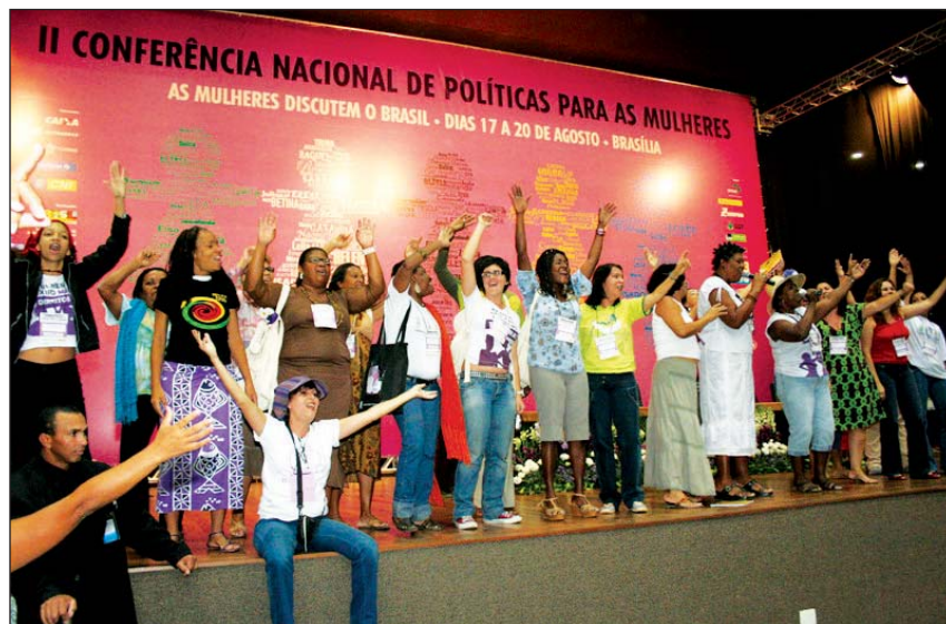
A Conferência Nacional de Políticas para as Mulheres, em agosto de 2007, mobilizou cerca de 200 mil brasileiras

As diretrizes anunciadas este ano estão organizadas em 11 áreas de atuação. Dessas, seis são novas: Participação das mulheres nos espaços de poder e decisão; Desenvolvimento sustentável no meio rural, na cidade e na floresta, com a garantia de justiça social, soberania e segurança alimentar; Direito a terra, moradia digna e infra-estrutura social nos meios rural e urbano, considerando as comunidades tradicionais; Cultura, comunicação e mídia não-discriminatória; Enfrentamento ao racismo, sexismo e lesbofobia; e Enfrentamento às desigualdades geracionais que atingem as mulheres, com especial atenção às jovens e idosas. A essas se unem os temas já incluídos desde a primeira versão: Autonomia, igualdade no mundo do trabalho; Educação inclusiva e não sexista; Saúde das mulheres e