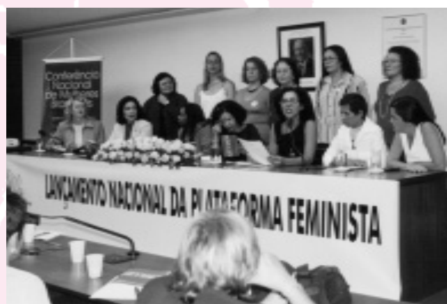
Lançamento nacional da Plataforma Política Feminista, no Congresso Nacional, realizado dia 6 de agosto.